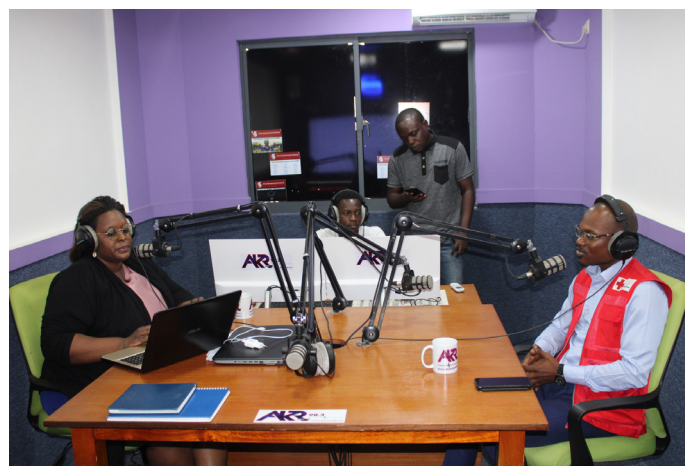
Le Consultant Communication lors de son passage à la radio Akum Radio.

Cette émission traitait de la prise en charge des personnes rescapées et des familles de victimes du naufrage par la cellule d'appui psychologique de la Croix-Rouge Gabonaise.