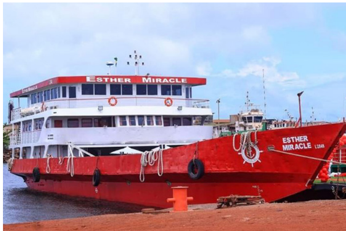
Le bateau ESTHER MIRACLE avant son départ

A la suite du décret émis par le gouvernement sur l'appui de la Croix-Rouge Gabonaise quant à l'enregistrement des personnes survivantes et des représentants légaux des familles des victimes et leur suivi psychologique, le dispositif s'est tenu du 20 au 31 mars 2023 au siège national de la Croix-Rouge Gabonaise.