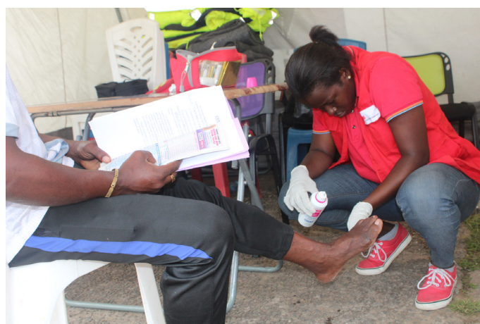
Une infirmière désinfectant une plaie.

Le récapitulatif des interventions réalisées au Port-Môle et au siège national de la Croix-Rouge Gabonaise se résume dans le tableau suivant :