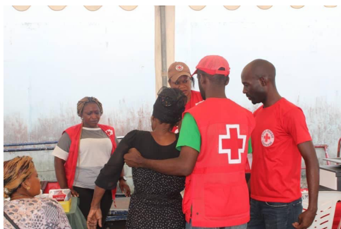
Un nombre important de malaises furent enregistrés.

Certaines personnes traitées ont par la suite été évacués à l'infirmierie de la marine marchande, ou